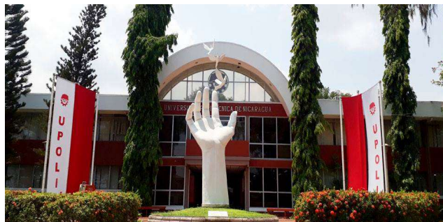
Imagen 1: Entrada Principal de la Universidad Politécnica de Nicaragua - UPOLI