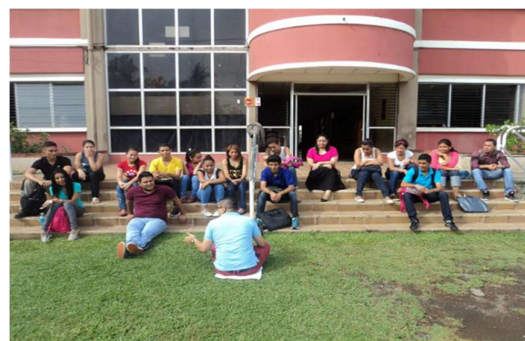
Imagen 5: Vista de una zona verde de la Universidad Politécnica de Nicaragua – UPOLI, donde se pueden concluir clases reflexivas y de análisis económico contextualizado.