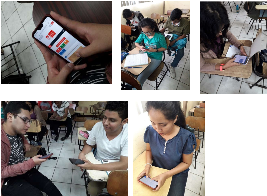
Imagen 10: La tecnología ha sido una gran aliada para masificar el uso de la Plataforma EVA – UPOLI: https://eva.upoli.edu.ni/