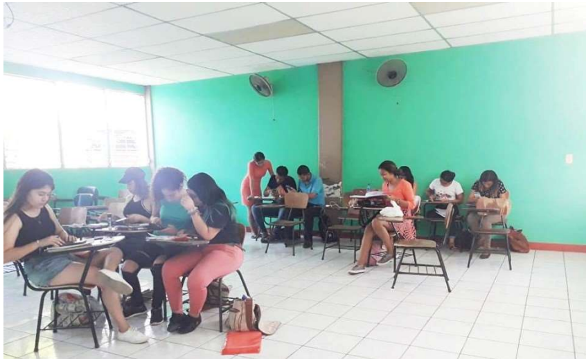
Imagen 8: Reforzamiento estudiantil. Cada vez es más que los estudiantes se ayuden entre ellos en las materias de mayor dificultad.