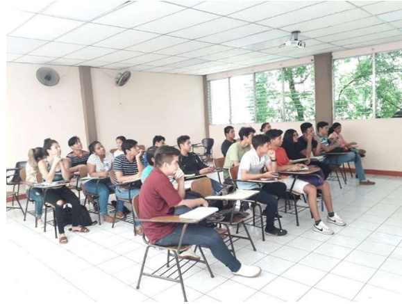
Imagen 7: Aulas de clases con estudiantes de Finanzas y Gestión Bancaria