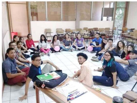
Imagen 11: Algunas técnicas lúdicas desarrolladas con los estudiantes de Finanzas y Gestión Bancaria, el Dinero para Operaciones Bancarias y las Chimbombas Calientes.