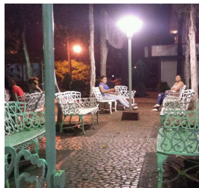
Imagen 3: Vista de Día y Noche del Parque los Madroños de la Universidad Politécnica de Nicaragua – UPOLI, equipado son asientos, iluminación y zona Wifi.