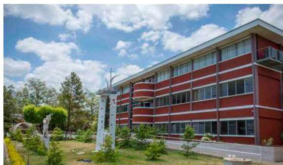
Imagen 2: Edificio I de la Universidad Politécnica de Nicaragua – UPOLI, el cual alberga a las aulas de la carrera de Finanzas y Gestión Bancaria.