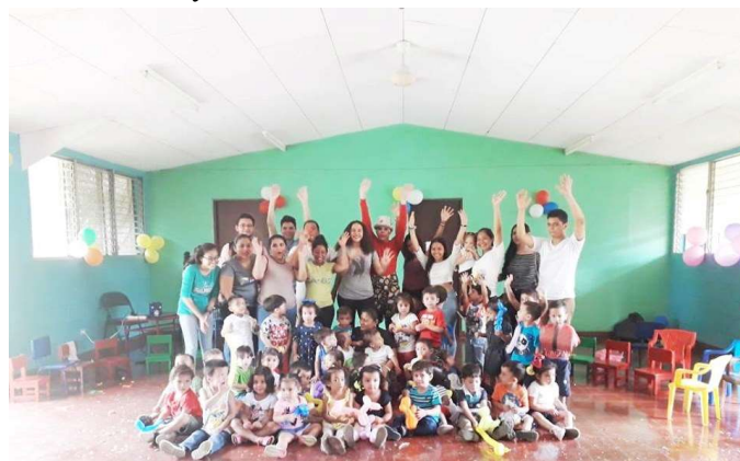
Imagen 6: Proyecto Social de Convivencia y Ayuda en el CDI Sol de Libertad, con estudiantes de Finanzas y Gestión Bancaria de Tercer Año, en la materia Reflexión Teológica.