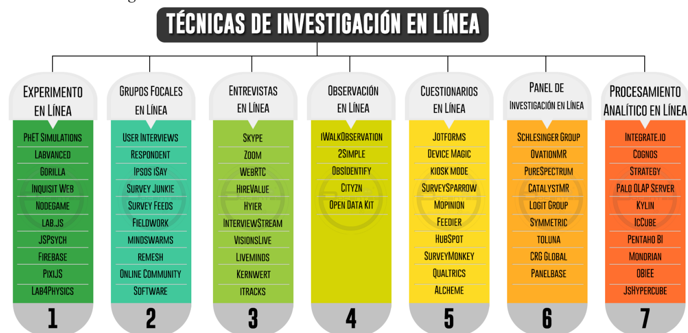
Figura 3 Técnicas de Investigación en Línea

Nota. Las técnicas de investigación son todas aquellas que permiten al investigador recopilar información de manera eficiente, elaborado por (Mujica-Sequera, 2022).