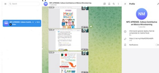
Figura 4 Canal en Telegram

Nota. Se aprecia el material en el canal de Telegram, elaboración propia (2022).