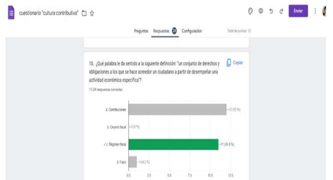
Figura 2 Ejemplo de Obtención de Carencia de Conocimiento

Nota. Se aprecia los valores obtenidos en el cuestionario, elaboración propia (2022).