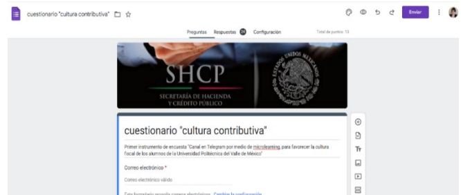
Figura 1 Cuestionario

Nota. Cuestionario aplicado en la población objeto de estudio, elaboración propia (2022).