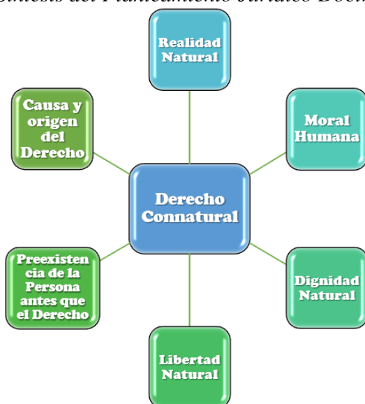
Figura 1 Síntesis del Planteamiento Jurídico Doctrinal.

Nota. Planteamiento Jurídico Doctrinal, elaboración propia (2024).